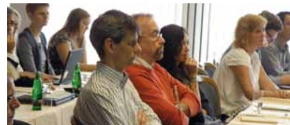
Koordinátorský team projektu na management setkání v Praze ve dnech 1. - 3. září 2010

Vedle šíření poznatků, zkušeností a výsledků z projektu se Potravinářská komora ČR rovněž přímým způsobem podílela spolu se švédským a belgickým sdružením výrobců čokoládových cukrovinek (CHOKOFA, CHOPRABISCO) na organiza-