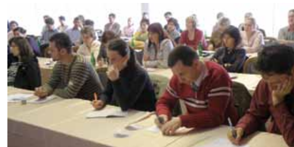
První dvoudenní školení zorganizované s účastí zahraničních partnerských výzkumných institucí/lektorů pro tuzemské výrobce čokoládových cukrovinek ve dnech 17. - 18. května 2010

Zjištění příčin a omezení tvorby trhlin a tukových výkvětů na povrchu při výrobě plněných čokoládových cukrovinek, publikace příručky s identifikací