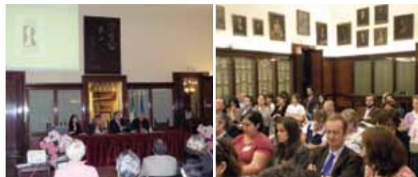
Oficiální zahájení v sídle koordinátora projektu, Università of Bologna

Velmi pozitivní bodové ohodnocení DG Research EU k projektu předloženým konsorciem SP.E.S. GEIE počátkem roku 2010 představuje pro Potravinářskou komoru ČR aktivní partnerskou roli v ko-