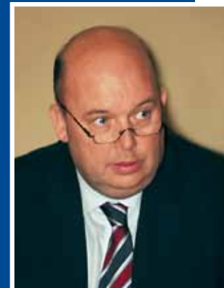
Miroslav Toman, prezident

Je potřeba zdůraznit, že významná část komunikace mezi Potravinářskou komorou ČR a jejími členy, podnikatelskou veřejností a státní správou se odehrávala a odehrává na půdě výborů, pracovních skupin a sekcí. Právě v nich se vytvářely pozice k jednotlivým okruhům otázek a řešeným problémům, a projednávala odezva průmyslu na české i evropské legislativní iniciativy. Rozhodující část aktivit byla v uplynulém období soustředěna do tří výborů (legislativního, pro životní prostředí a pro vědu a výzkum), tří pracovních skupin (pro zdravý životní styl, pro obchod a marketing a pro bezpečnost potravin) a čtyř sekcí (pro zmrazené potraviny a zmrzliny, pro pekařské přípravky, pro biopotraviny a pro mléko).