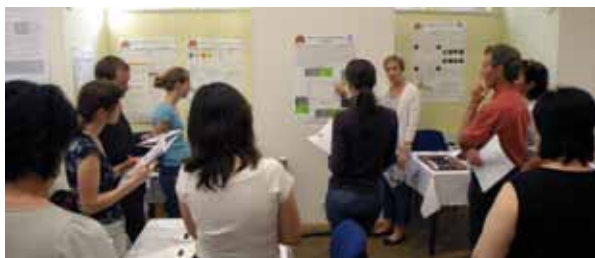
Druhé dvoudenní školení zorganizované s účastí zahraničních partnerských výzkumných institucí/lektorů pro tuzemské výrobce čokoládových cukrovinek

ci prvního dvoudenního školícího kurzu pro výrobce čokoládových cukrovinek ve východní, severní a střední Evropě. Ve spolupráci s VŠCHT Praha (Ústav chemie a technologie sacharidů) tento 1. kurz proběhl pro tuzemské výrobce v Praze ve dnech 17. – 18. května 2010. Druhý závěrečný kurz, k jehož realizaci dojde rovněž v Praze a to ve dnech 10. – 11. května 2011, představí teoretické i praktické výsledky vycházející ze spotřebitelských průzkumů a relevantních výzkumných aktivit celého projektu.