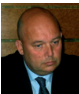
Miroslav Toman, prezident PK ČR

„ Pro Potravinářskou komoru ČR znamenal rok 2007 řadu významných aktivit, do kterých se zapojila, a to jak na domácím, tak na mezinárodním fóru. “